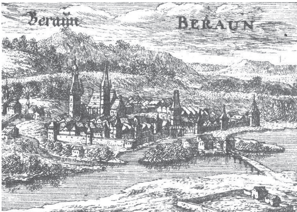
Beroun v 17. století