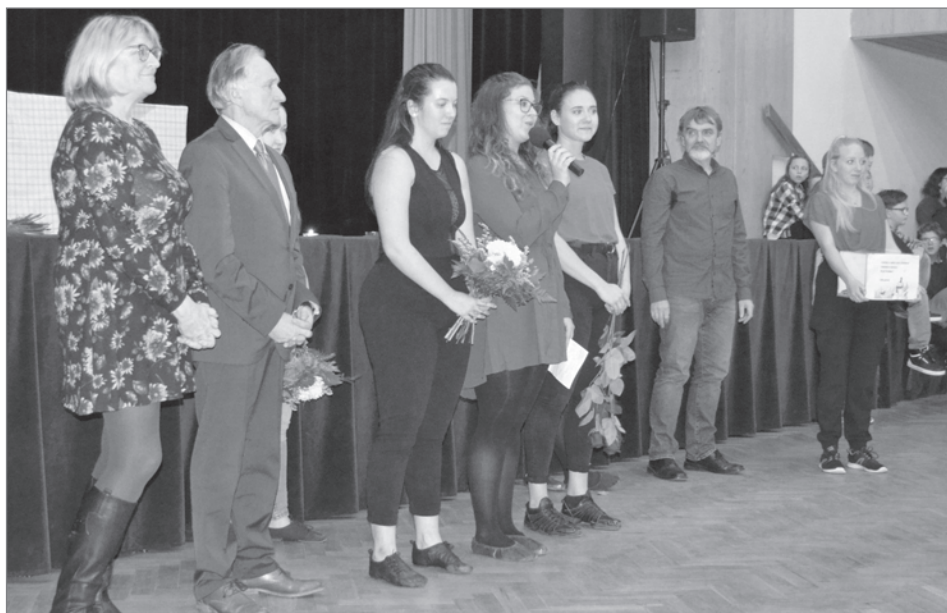
První adventní neděle se v NKC konal 2. ročník charitativní akce Klobouček tančí dětem. Více se o této krásné akci dozvíte na straně deset.