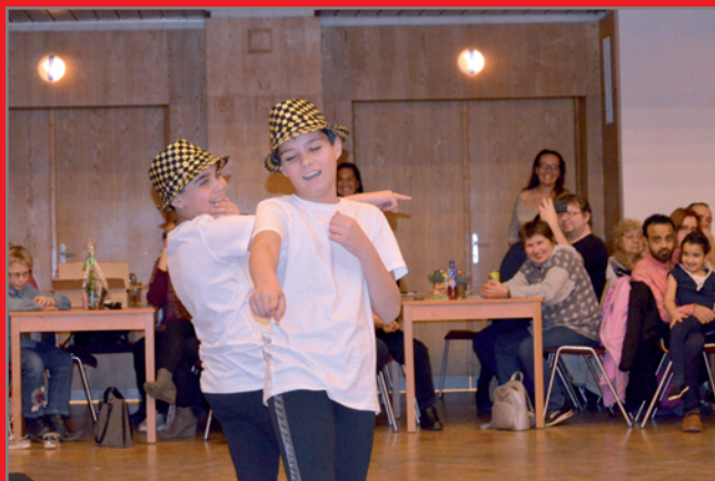
Klobouček tančí dětem