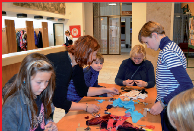
Faustování - výtvarná dílna