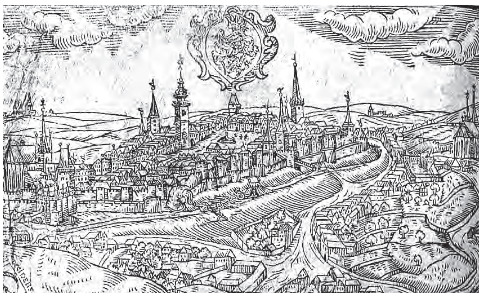
Slaný kolem roku 1600