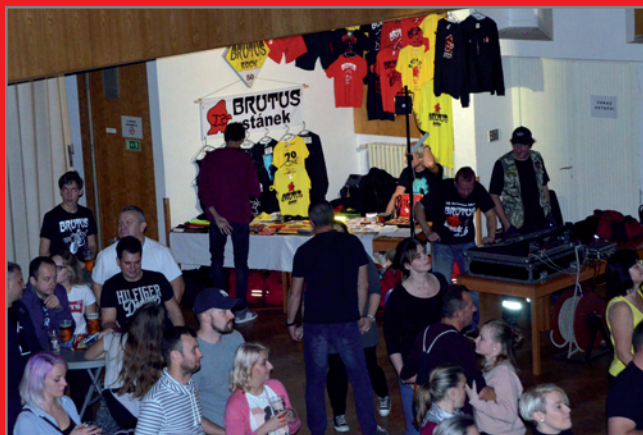
Koncert Brutus v NIK