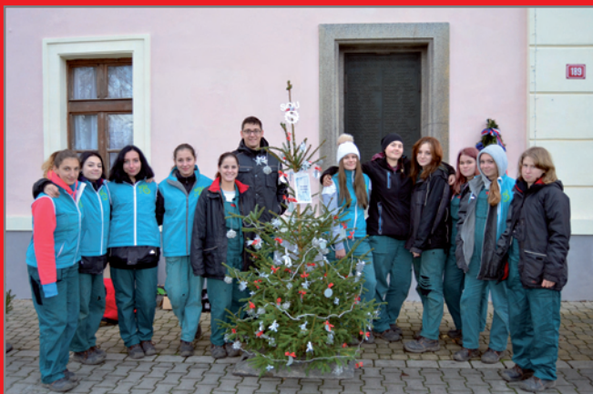
Žáci SOJ - soutěž o nejhezčí vánoční strom