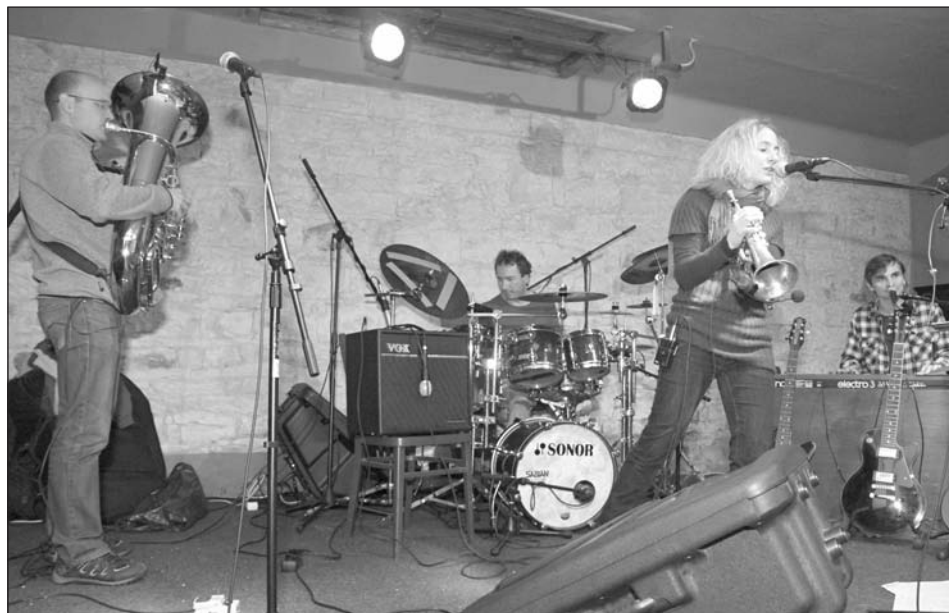
Koncert Trabandu v hospodě Na Růžku v Pecínově.