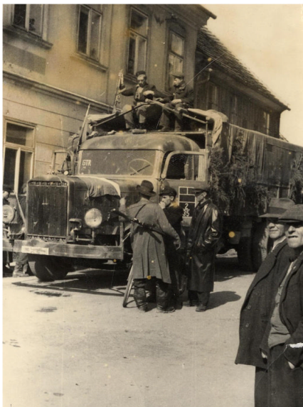
Opět stejná situace a stejný automobil - s partyzány, povstalci a civilisty

V obci a okolí se už na jaře rodilo povstalecké centrum, seskupené kolem majora bývalé čs. armády Pavla Malíka. Povstání však ještě 2. a 3. května nenastalo, obyvatelé neplnili ulice a nevyvěšovali ještě prapory. Podle pamětníků se povstáním rozbíhalo po odchodu vlasovců, od 4. května. Četnická stanice hlásí, že ve 23 hodin přišel „fonogram“ o odstraňování německých nápisů. Malíkova skupina vyvěsila na domě čp. 24 na Smetanově náměstí čs. vlajku a postavila k ní hlídku. To potvrzují i záznamy pamětníků a kronika města.