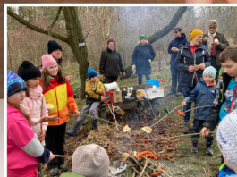
Jaro bylo v sobotu