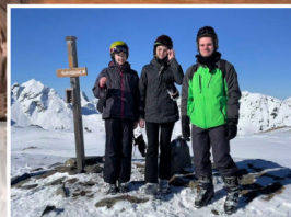
Hurá do Alp