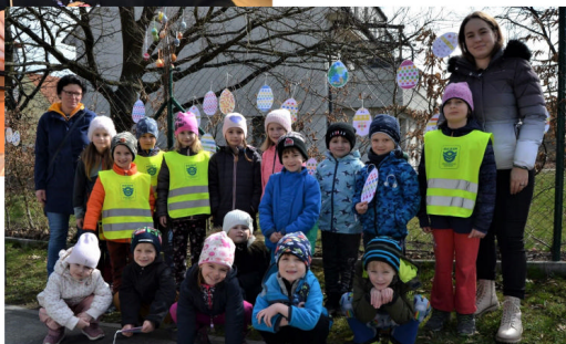
MS Zahradní ve venkovní velikonoční 'galerii'