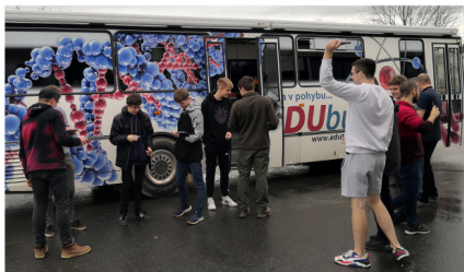
Studenti před EDU busem

Přínosné bylo měření objemu plynů v ovzduší, např. kolik produkujeme CO 2 při jediném výdechu. Studentům je tedy již jasné, proč se musí větrat třídy.