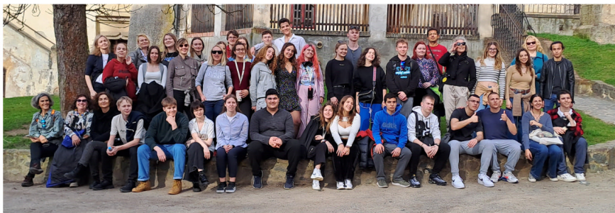
Výlet na Křivoklát