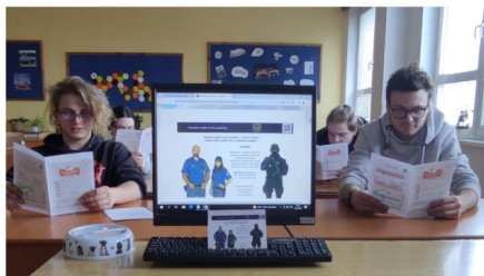
Návštěva ve věznic

Akce měla přiblížit, jak to v tomto podniku vypadá a jaká je náplň práce jednotlivých pracovních pozic.