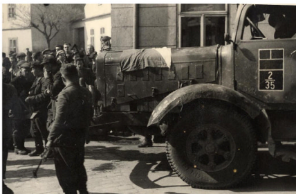
Snímek prezentovaný jako příjezd vlasovců do města

Podle revničovské obecní kroniky přijelo do tamní obce 29. dubna „přes 700 Rusů armády Vlasovovy se 600 koňmi a 10 obrněnými pancéřovými vozy“. Dále s sebou měli asi 200 povozů a následně dojížděli další vojáci. Z obce udělali základnu pro další výpady, například do Krušovic, na Krupou nebo na nádraží v Lužné či v Rakovníku. Aktivitami vlasovců se opět nezabýváme, důležité jsou další údaje z revničovské kroniky: „Dne 3. května se celá posádka hnula odsud k Nov.