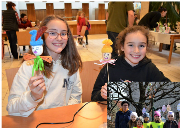
Velikonoční jarmark v NKC