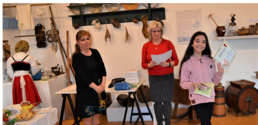
Soutěž o nejlepšího velikonočního beránka