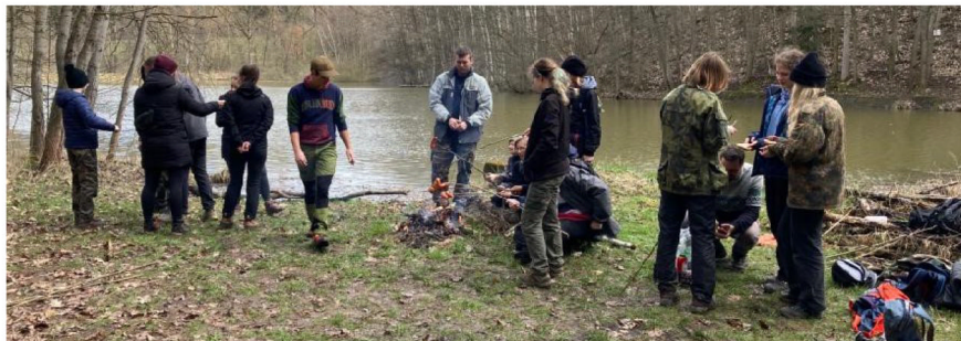
Skautský oddíl Mušketýři