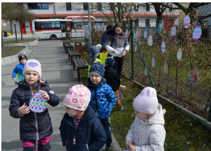
U školní jídelny