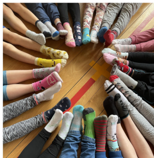
Ponožkový cirkus záruk 2. B

Dne 21. března bylo ovšem na chodbách naše základky takových "bláznů" se švihlými ponožkami habaděj. Odvážnou módní kreací žáci vyjádřili souznělost s lidmi s Downovým syndromem (jedná se o Světový den Downova syndromu pod záštitou OSN).