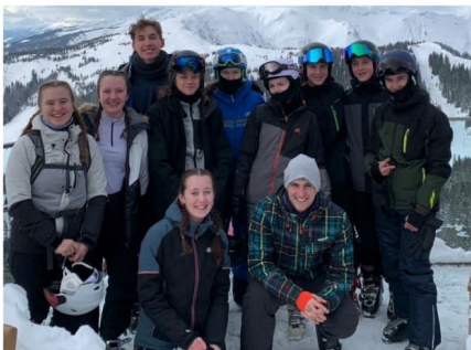
Účastníci lyžařského zájezdu

Středa byla odpočinková. I přesto jsme alespoň dopoledne vyrazili na svah, ale spíše turisticky. Tento den totiž patřil Kaprunu, špičkovému rakouskému středisku, jehož sjezdovky se nacházejí i ve výšce přes 3000 metrů nad mořem a lyžuje se tam i v letních měsících. Nahoru jsme jeli