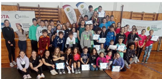
Účastníci OVOV ze Strašecí