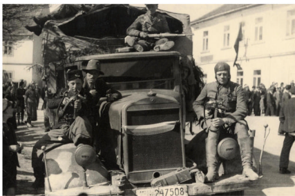
Totéž dopoledne s partyzány, povstalci, civilisty a s dalším ukořistěným německým autem. Povstání je v plném proudu

Z uvedených zpráv můžeme přijmout několik závěrů. Strašečtí povstalci i rudští partyzáni disponovali s ukořistěnými německými nákladními automobily. Logicky je označili československými symboly, aby nedošlo k záměně s nepřáteli. Tak to vidíme na vystavené fotografii. Na snímcích je povstání v plném proudu, ovšem je také patrné, že výjev