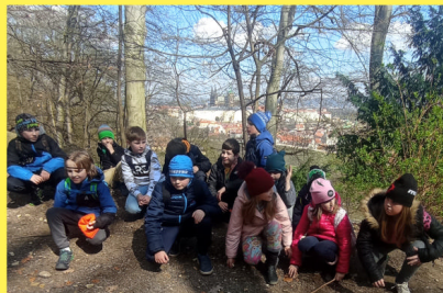
Text a foto Jitka Samšuková

Uskutečnil se 6. dubna. Děti se podívaly na Petřín a do oblíbeného Zrcadlového bludiště.