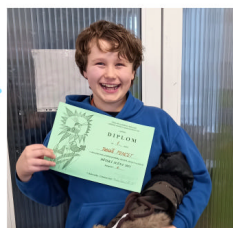
Vítěz okresního kola recitační soutěže