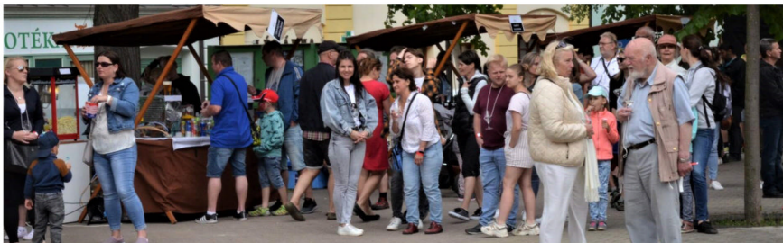
Loňské Zázraky vína