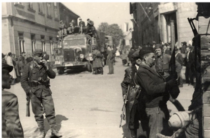
Stejná situace o pár vteřin dříve - s vojáky v německé uniformě, s partyzány, s místními povstalci, civilisty a s vyvýšenými vlnkami

Mezi fotografiemi z povstání 1945 uloženými v novostřešeckém muzeu je menší skupina snímků pořízených ve městě v místech ústí Nádražní ulice na Tyršovo náměstí. Obrázkům dominuje německý nákladní automobil Mercedes Benz, zčásti maskovaný větvejí a s československou vlnkou přetaženou přes motor. Okolo se nachází čilý ruch, pohybují