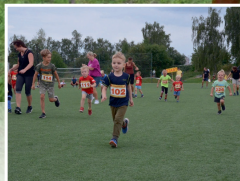
Novostrášecký běh 2023