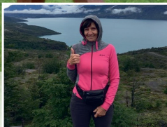
Nad žádnou změnou jsem neplakala