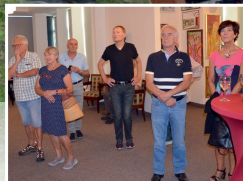
Vernisáž výstavy Radost