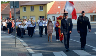
Průvod od Pěknou