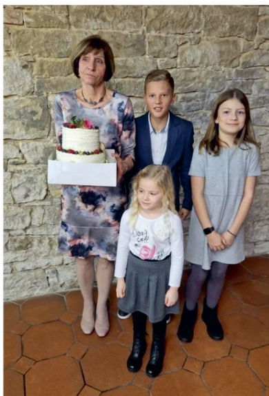
S vnučaty při jubileu

My jí ho dáváme a upřímně přejeme, aby se Sestrou mého srdce stala právě ona.