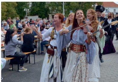
Historické poselstvo doprovází skupina BraAgas