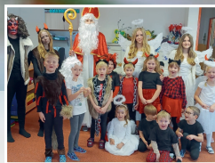
Mikulášská nadílka v MŠ a ve školní družině