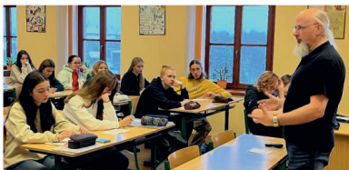
Studenti na přednášce

přítom kladen na odpovědné a zdravé chování v partnerských vztazích.