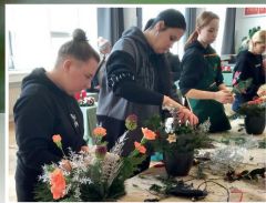
Obrovský úspěch zahradnic ze SOU Nové Strašecí