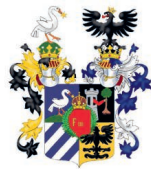
Erbov rodů Losyů z Losinthalu