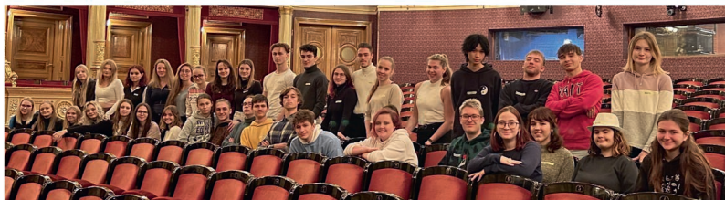
V Národním divadle