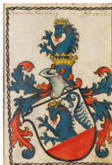
Erb rodu Starhembergi