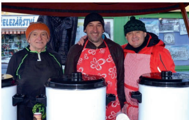
Starosta s oběma místostarosty při tradičním rozlévání svařeného vína během akce Rozsvícení vánočního stromčku