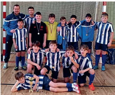
Vítězný Bílý tým

Neměl dobrý start do turnaje, kladenský Slavoj nás vpravodil 5 góly. Klukům se tento zápas vůbec nepovedl a nepředvedli jsme opravdu nic. Druhý zápas přinesl zlepšení a jeho výlety na soupeřovu polovinu dala šanci zabojovat v posledním zápase o postup do „Zlaté skupiny“. V cestě nám stál druhý tým Tatraru Rakovník. Byl to bojovný zápas,