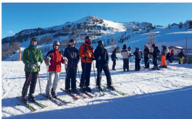
Lyžaři ze SOU v Alpách

Také účast mužstva SOU v sálové kopané v dlouhodobé soutěži Středoškolská futsalová liga byla v letošním školním roce velmi úspěšná. Po podzimní části a dvou turnajích v listopadu, si chlapci z SOU zajistili postup do finále oblasti, tzn. do turnaje vítězných mužstev z cca poloviny Středočeského kraje. Organizátorem Středoškolské futsalové ligy je Fotbalová asociace ČR a ta delegovala pořadatelství tohoto finálového turnaje na 8. ledna na SOU Nové Strašce.