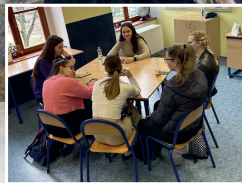
Absolventi gymnázia diskutovali se současnými studenty