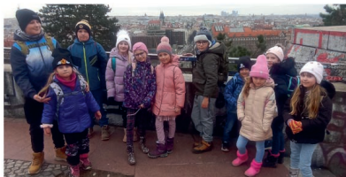
Na střeše zemědělského muzea