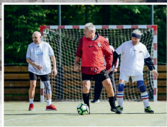
Uchytí se fotbal v chůzi také ve Strašeci?