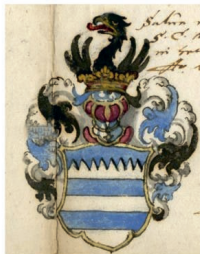
Erb Miseronů z Lisonu