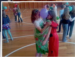
Karnevaly pod taktovkou DDM