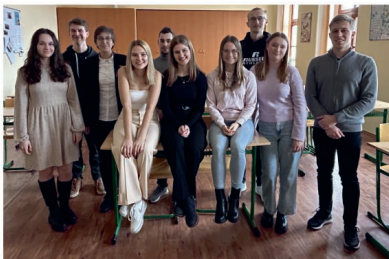
Absolventi gymnázia se do své školy rádi vrací

Na druhou část veletrhu se studenti i hosté přesunuli do místnosti, kde měl každý náš absolvent připravené své stanoviště a mohl se věnovat skutečným zájemcům o daný obor. Tady byl prostor pro konkrétní otázky a ze strany