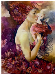
Jeden z obrazů S. Žalmánkové