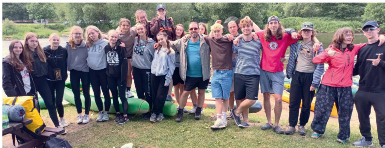
2. B na Ohři