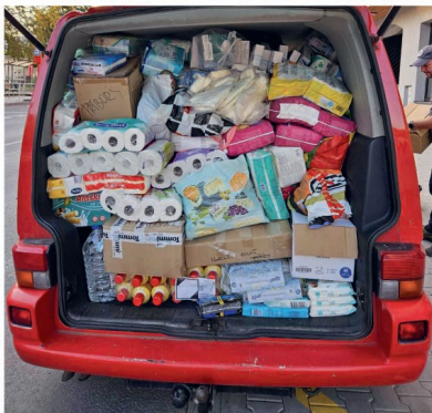
Jedna z dodávek s humanitární pomoci