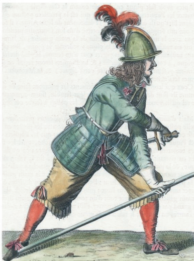
Voják z třicetileté války

Právě v této době muselo dojít k údajnému přepadení císařského vojáka, neboť jméno Holzappela se vyskytuje v uvedených žalobách. Všeobecné vyčerpání zdlouhavým vojenským konfliktem se odrazilo především v zázemí. Města a vesnice se obávaly každého, nerozlišovaly mezi