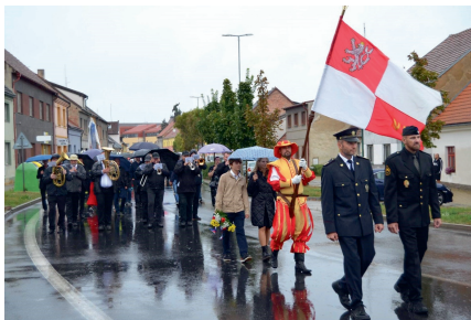
Právod o pěknou proběhl tentokrát v dešti