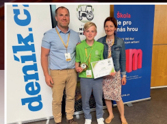
Nejlepší mladý zemědělec je ze Strašeka