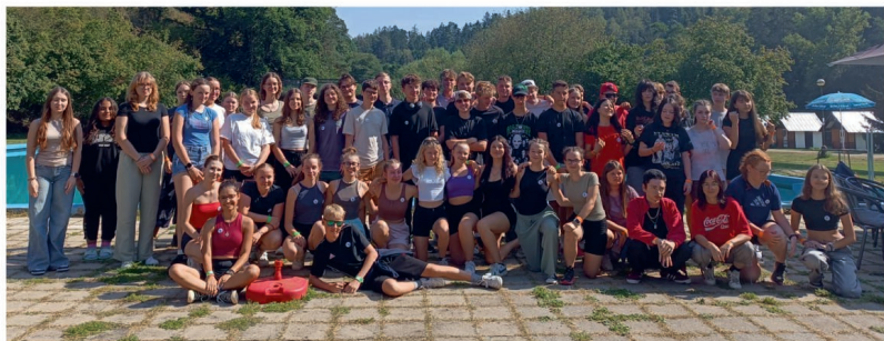
Obě třídy pohromadě