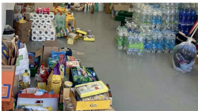
Humanitární pomoc v hasičské zbrojnici

Díky obrovskému úsilí občanů našeho města, okolních obcí, dobrovolných jednotek, firem, institucí, našich hasičů a pracovníků města Nové Strašecí bylo možné přivést, vybrat, vyřadit, zaevidovat, nabalit a naložit dodávku takto velké humanitární pomoci.