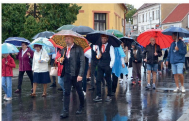
Průvod deštivým městem