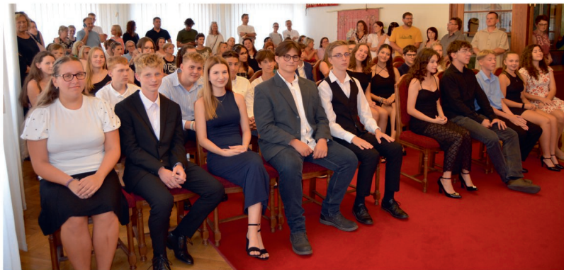
Imatrikulace – 1. část