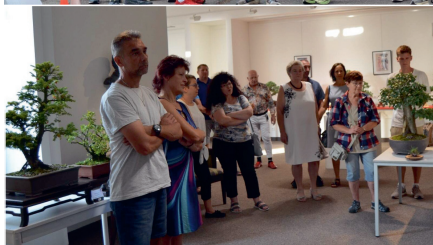
Tradiční výstava bonsai a suiseki opět přitáhla velkou pozornost