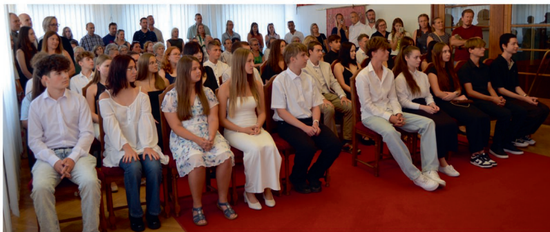
Imatrikulace - 2. část