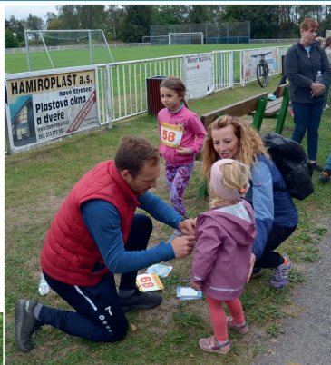
Příprava na NS běh