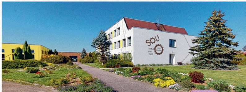
Budova SOU NS