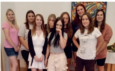
Školní aranžéri výstavy

strašecké kulturní centrum. Jejich přírodní výrobky hrály všemi barvami. Milovníci květin se mohli v období posvícení přijít podívat na nejrůznější typy květinových dekorací a inspirovat se těmi nejčerstvějšími trendy. Naši nadšení budoucí zahradníci a zahradnice zvládli opravdu skvělou práci.