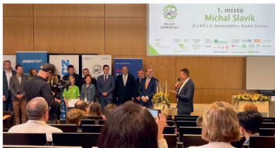
Vyhlášení vítěze soutěže

Počítám s tím, že po střední škole půjdu na vysokou zemědělskou, spíš ale do Suchdola, Brno je moc daleko.