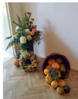
Ukázka květinové výzdoby