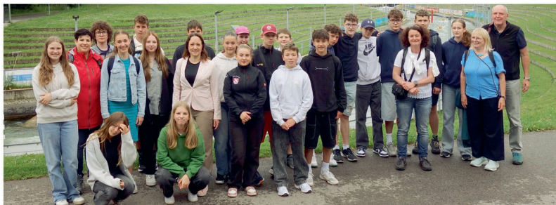
Žáci s učiteli u vodního kanálu