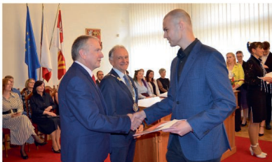
Předávání maturitních vysvědčení

Některé, jako je např. vyklizení nepotřebných věcí, byly započaty již koncem června. Těžiště prací je plánováno na prázdninové dny.