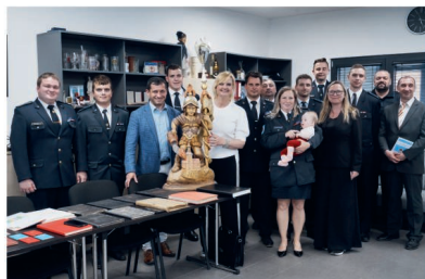
U strašeckých hasičů

První zastávkou nabitého programu bylo SOU NS. Učiliště nabízí tříleté učební obory: automechanik, opravář zemědělských strojů, zahradník, a také dvouleté nástavbové studium zakončené maturitou. Během návštěvy se diskutovalo o dalším rozvoji školy, včetně plánovaných investic do oprav vodovodního a kanalizačního vedení a rekonstrukce školní jídelny.