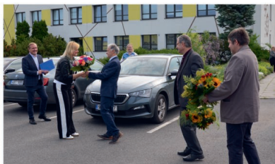
Návštěva v SOU

Ivana Rezková s využitím informací Středočeského kraje