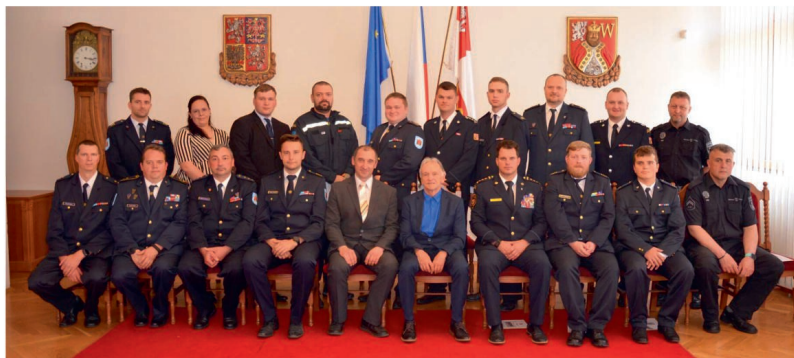
Hasiči a městští strážníci se starostou a místostarostou