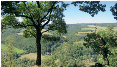
Pohled z vyhlídky

O hradišti ohraničeném dodnes patrným valovým opevněním dlouho panovaly nejasnosti. Teprve výzkumy ZČU v Plzni a Muzea T. G. M. Rakovník v posledních letech, které přinesly nemnoho datovacích nálezů, potvrdily, že ostrožna byla využívána v pozdní době bronzové, v nejmladší fázi laténského období a v období od poslední třetiny 8. století do počátku 9. století.