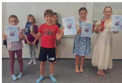
Vítězové 3. kategorie