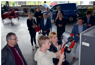
Pani hejtmanka u svářečského trenážeru

Třetí část programu Vedení kraje na cestách patřila neformálnímu setkání s těmi, kdo nejlépe znají místní potřeby – se starosty okolních obcí.