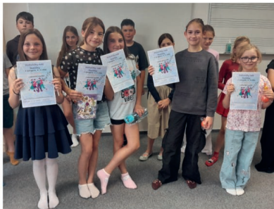
Slávné vítězky 2. kategorie

Ve středu 4. června odpoledne se v hudebně 2. stupně sešlo celkem 42 zpěváčků. S posouzením jednotlivých výkonů nám pomohla paní učitelka Claudie Kosová, která vede hodiny hudební výchovy na 2. stupni. Drobnosti pro vítěze zajistila paní Jitka Samšuková z DDM Nové Strašecí.