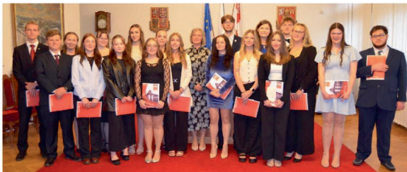
Předávání maturitních vysvědčení 4. B.