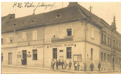
Někdejší hostinec U Černého koně s tabulkou konika na nároží

Asi třetí hospodu je v Sommerově popisu míněna šenkovna na radnici , kde se střídali různí nájemci.