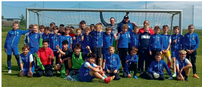
Fotbalisté ve Weldenu