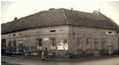
Bývalý hostinec U Kochmanů před demolicí