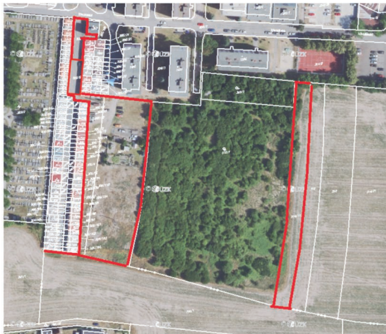
Městem vlastněné pozemky v rozvojové části Křivoklátského sídliště