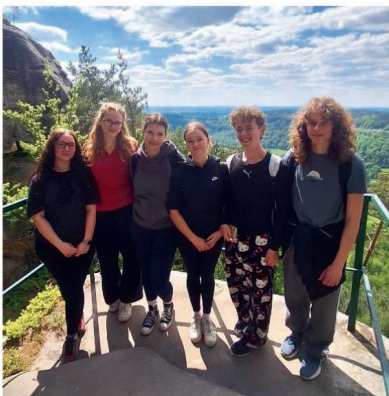
Na Malé Skále

Program posledního dne byl oddechový. Většinu dopoledne jsme si pečlivě balili věci a ve dvanáct hodin vyrazili na krát-