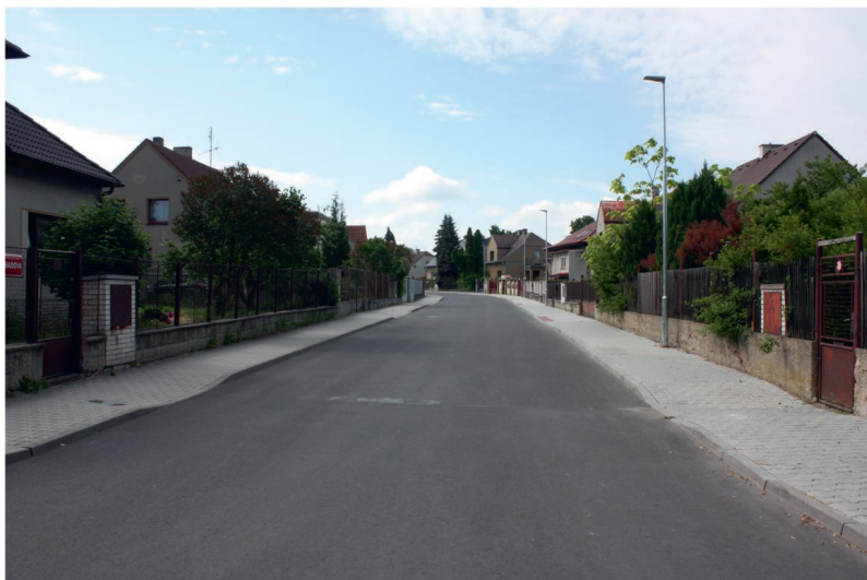
Rekonstrukce Rabasovy ulice