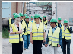
Vedení kraje na cestách