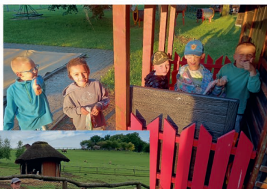
S přáním krásného léta kolaktiv MŠ U Lesíka

Zážitky dětí MŠ U Lesíka ve fotografiích