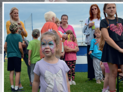
Dětský den na fotbalovém hřišti