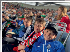
Mladí fotbalisté ve Weldenu