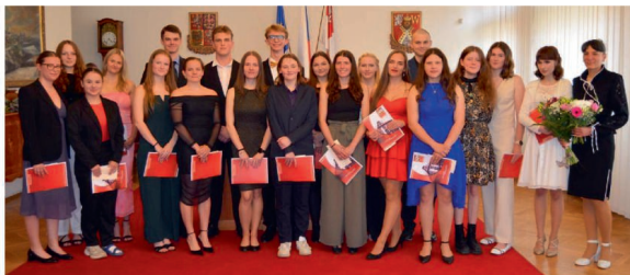
Předávání maturitních vysvědčení 4. A.