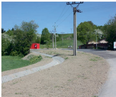
Odbor investic MěÚ

Stavba byla převzata bez nedodělků v požadované kvalitě a dokončené dílo přispěje k dalšímu rozvoji města v lokalitě U Hamira.